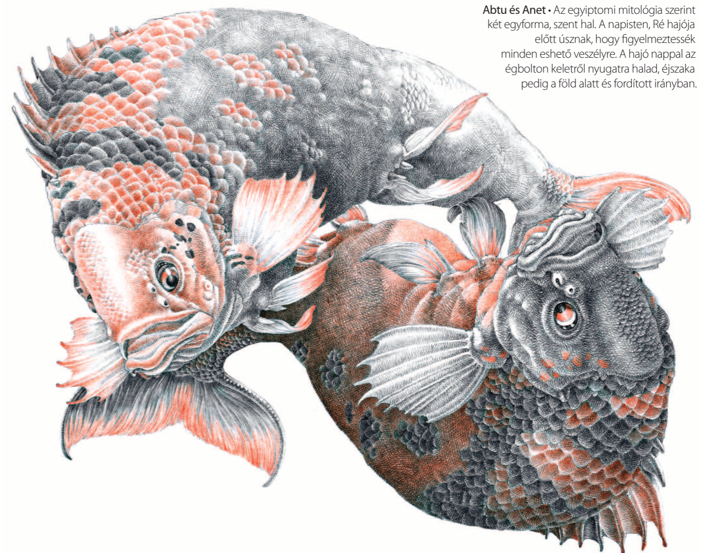
Abtu és Anet • Az egyiptomi mitológia szerint két egyforma, szent hal. A napisten, Ré hajója előtt úsznak, hogy figyelmeztessék minden eshető veszélyre. A hajó nappal az égbolton keletről nyugatra halad, éjszaka pedig a föld alatt és fordított irányban.