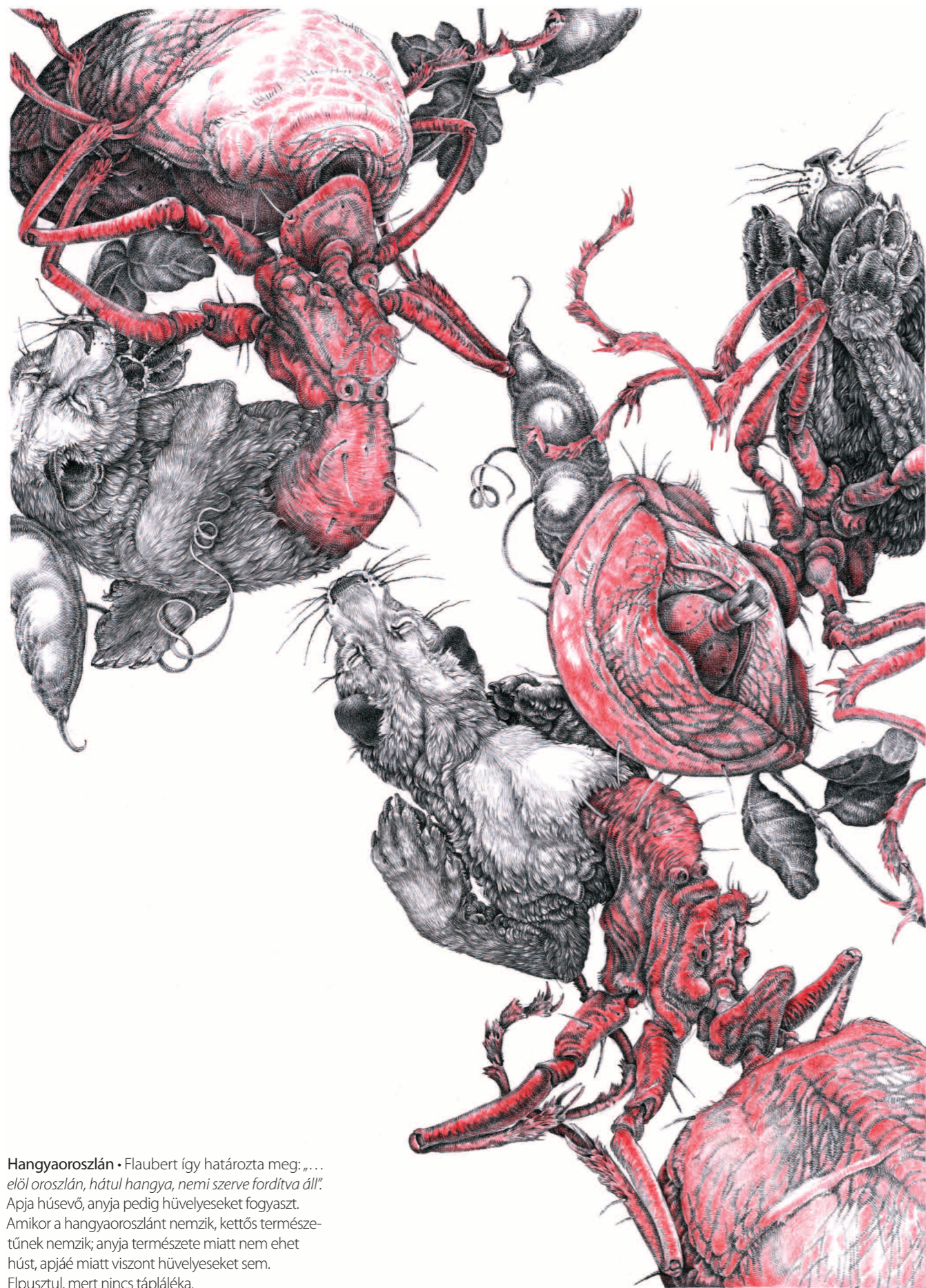
Hangaoroszlán • Flaubert így határozta meg: „... elől oroszlán, hátul hangya, nemi szerve fordítva áll”. Apja húsevő, anyja pedig hüvelyeseket fogyaszt. Amikor a hangyaoroszlánt nemzik, kettős természetűnek nemzik; anyja természete miatt nem ehet húst, apjáié miatt viszont hüvelyeseket sem. Elpusztul, mert nincs tápláléka.

ide?) adott első válasza. Ennyitől azonban nem áll össze a kép, ennyi nem elég a kielégítő válaszhoz. Tudtam, hogy az egész intézménynek valamivel több szerepet kellett kapnia ahhoz, hogy azt csinálja, amit ma, s ami teljes alkotói habitusa kiteljesítésében segítette.